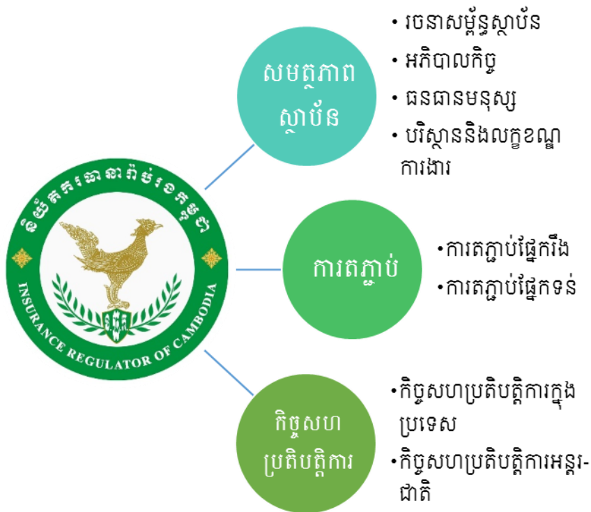
រូបភាពទី២ ÷ គំនូសបំព្រួញនៃសសរស្តម្ភទាំងបី